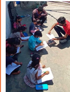
Ältere Schüler beschäftigen nun die Kinder im Freien

Bis zum Ende des absoluten Lock-downs wurden täglich 550 Essenspakete (Reis und Linsen) geliefert und ausgeteilt. Alles ging dabei sehr diszipliniert zu – dank der stets anwesenden Schulleiterin und der Krankenschwester. „Ihr habt uns nicht verhungern lassen,“ sagten die Menschen im Madrasi-Slum dankbar.