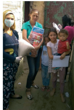
Willkommene Unterstützung in vielen Lebensbereichen

Armen Familien wird sogar Übungsmaterial für die Kinder überbracht – dazu auch Lebensmittelsäcke.