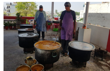
Großartige Hilfe durch Kochen von warmen Mahlzeiten