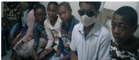
Kinder warten auf ihre Untersuchung

• Wie geplant wurden Kinder der Blindenschule SEJAFITO in Toliara untersucht, behandelt wo nötig, bzw. mit Brillen versorgt.