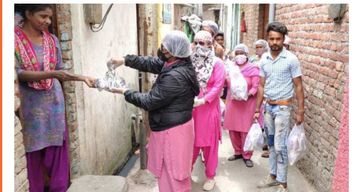
Engagierter Einsatz gegen Hunger im Slum

Doch ist es fraglich, wann Schulen wieder öffnen dürfen, denn die Covid-19-Pandemie steigt in Indien immer noch an.